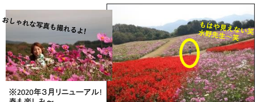
おしゃれな写真も撮れるよ! ※2020年3月リニューアル! 春も楽しみ~

水) 植物は天然の恵み「精油」の大本もと。 香りの癒しが詰まってこの空間にいるだけで贅沢!! さらに広大な敷地に緩やかな傾斜。お花見ながらいい運動! 土を思い切り踏みしめられるのは、ある意味ご褒美♪